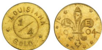
Louisiana $1/4 1904 gold (ej auktionsobjektet)